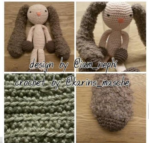
Kleiner Hasi designed by Nephi-Handmade