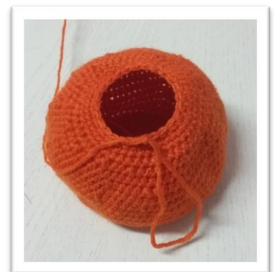
Bild zeigt fertige rd 27