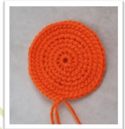
Bild zeigt fertige rd 7