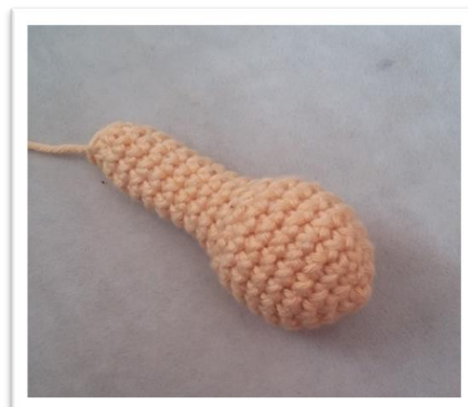
Bild 1 fertig gehäkelter Arm

letzte Masche abhäkeln und beenden, langen Faden lassen zum Annähen