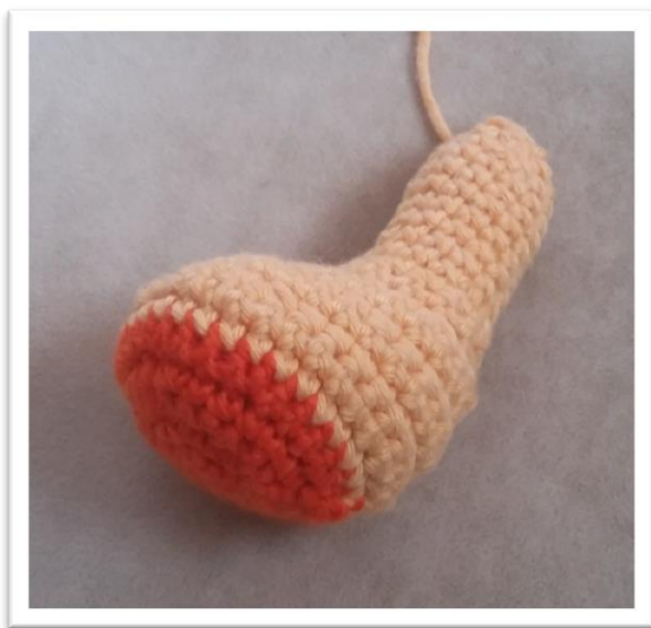
Bild 5 fertiges Bein