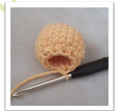
nach rd 10 ausstopfen