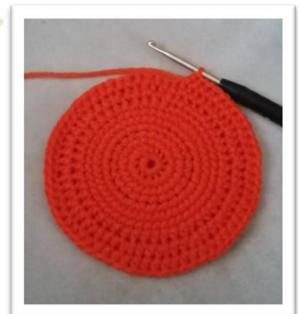
Bild zeigt fertige rd 10