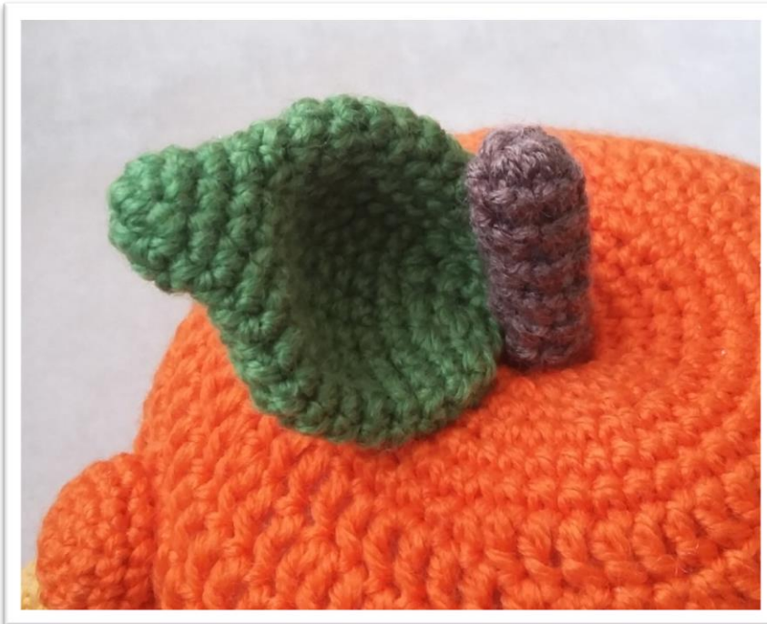
Das Blatt am Stiel und am Körper festnähen