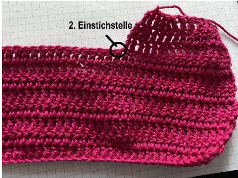
Vorderteil mit Armloch und 2. Einstichstelle für den Beginn des Rückens

Den Faden abschneiden und bei der 2. Einstichstelle anfangen Die Arbeit ab jetzt immer mal an den Blumikus gehalten wird, um zu gucken, ob er passt.