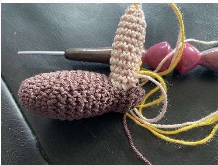
Fertiges Bein mit Schuh noch ohne Rand