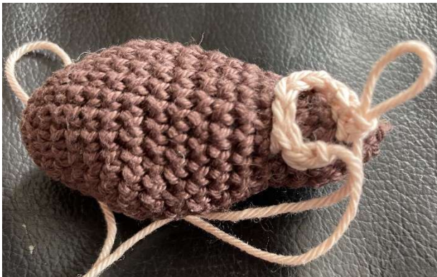
Schuh mit Einhäkeltunde von 10 Maschen

Es werden 10 Maschen im Bereich der Ferse eingehäkelt. Ich habe 2 Maschen unten und oben und 3 auf den Seiten eingehäkelt.