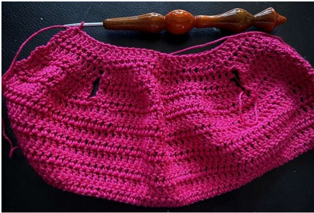
Mantel mit 3 Reihen Stäbchen über Armloch