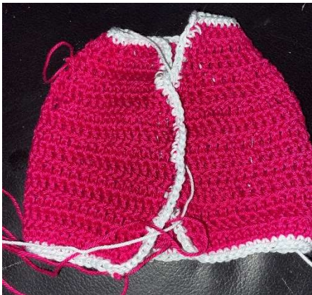
nach einer Reihe Arktikweiss

1 bis 2 Runden fM um den ganzen Mantel herum arbeiten, dabei in die Ecken jeweils immer 3 fm machen