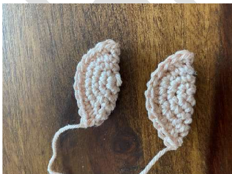
Fertige Ohren Faden stehen lassen zum annähen