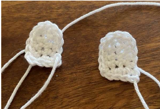
Fertige Augen Faden zum Annähen stehen lassen