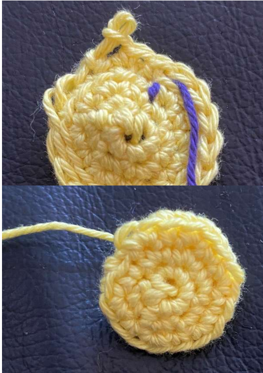
Blütenkopf mit Runde ins HMG