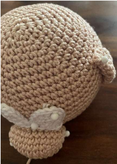
Kopf von Oben