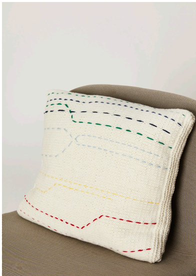
Sticken, Stricken Embroidery Kissen