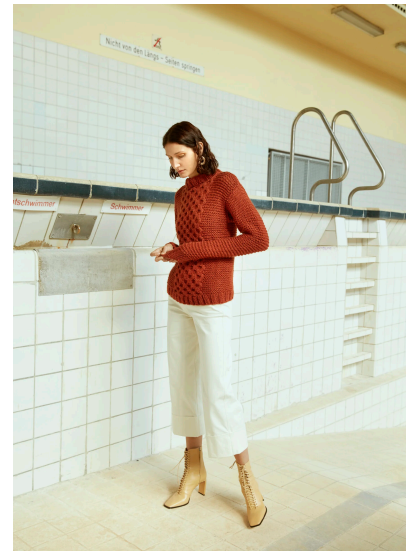
Stricken Dicker sportlicher Pullover