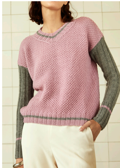
Stricken Pullover im Briochemuster und Rippenärmeln