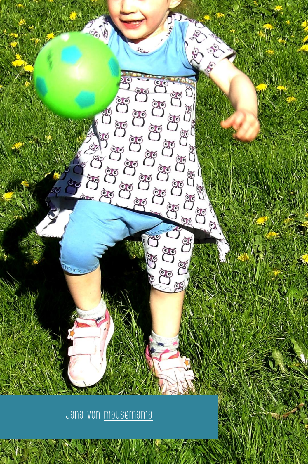
Jana von mausemama