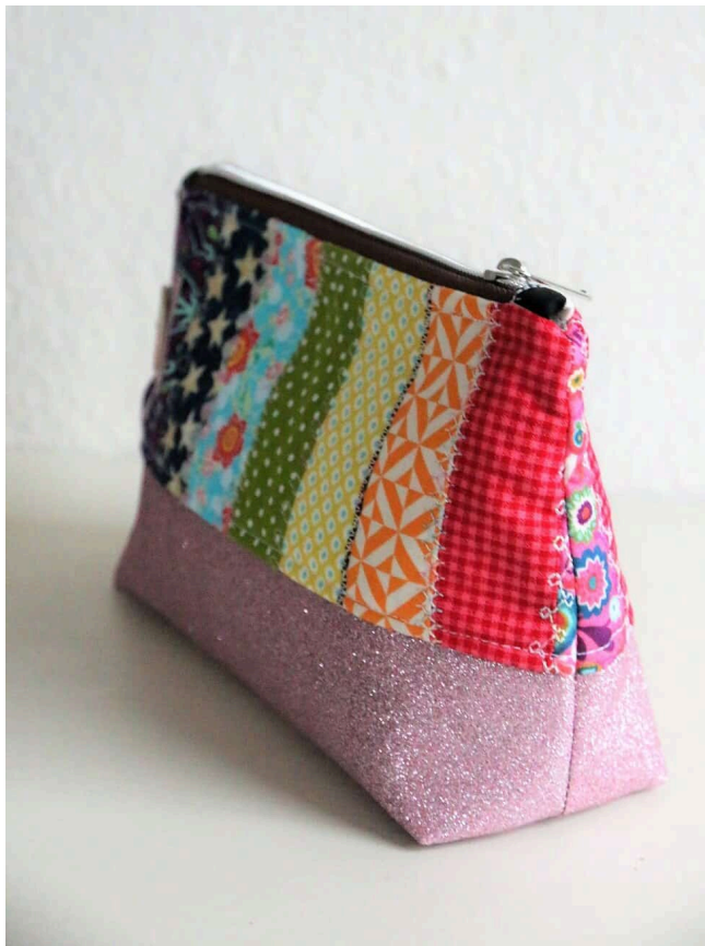
Schnittmuster: Kosmetiktasche Alsterprinzessin