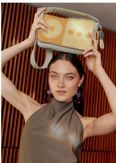
Stricken Mach dein Ding 2024 – Umhängetasche mit Wechselklappe