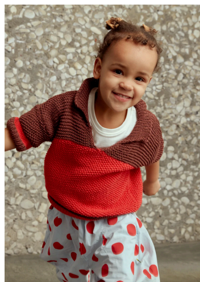
Stricken Kinderpullover Ingeborg