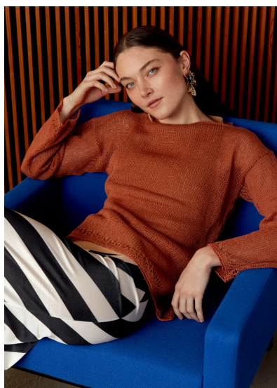
Stricken Pullover Isabella