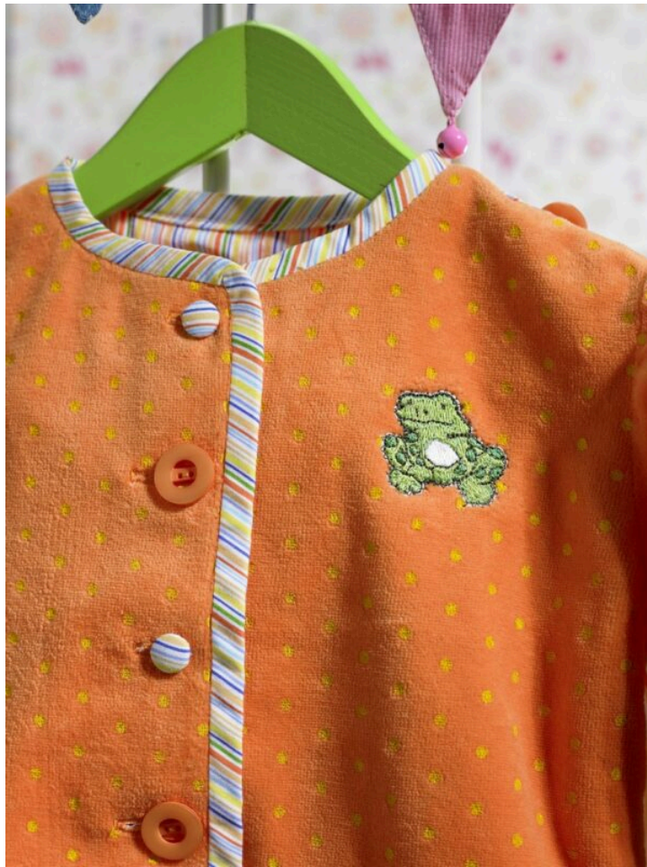
( https://blog.bernina.com/de/wp-content/uploads/sites/2/2014/04/Bild-009.jpg )