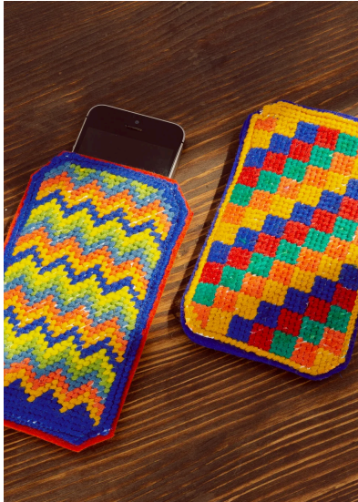
Sticken Phone-Hüllen mit Grafikmuster