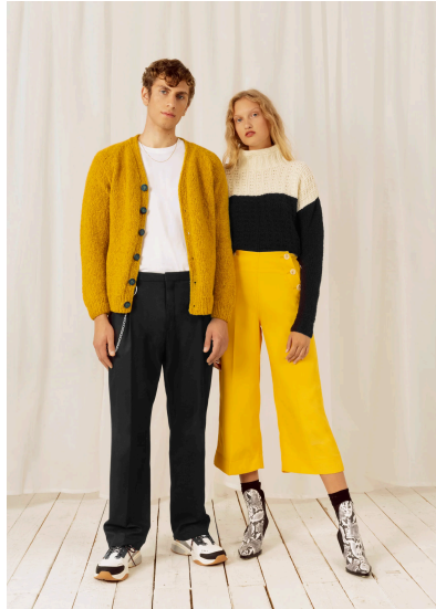
Stricken Herrenjacke mit Raglanärmeln