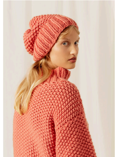
Stricken Pullover mit Perlmuster