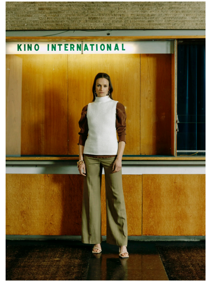
Stricken Top Cansu