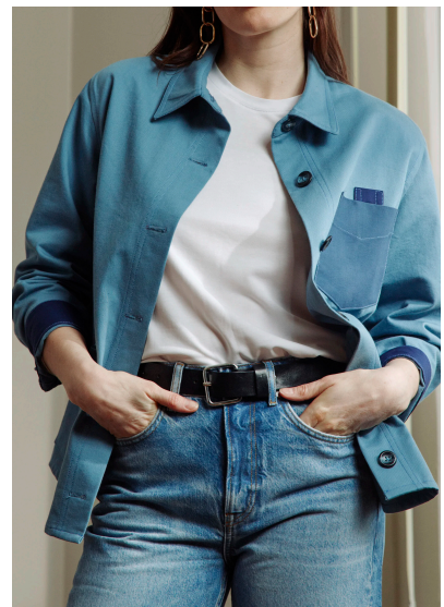
Nähen Hemdjacke Elisabetta