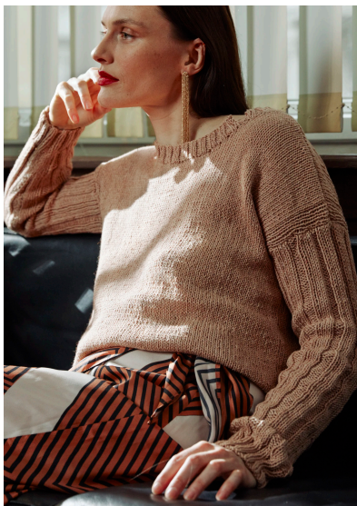
Stricken Pullover Esme