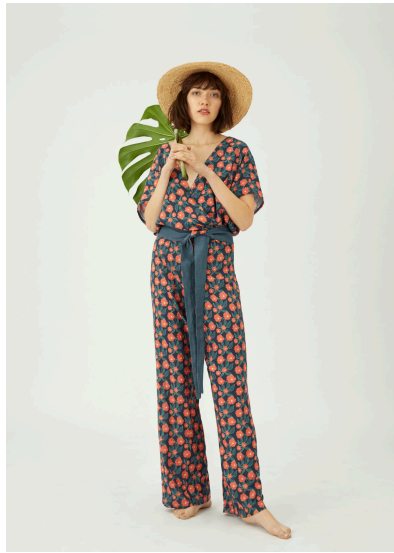
Nähen Blumen Jumpsuit