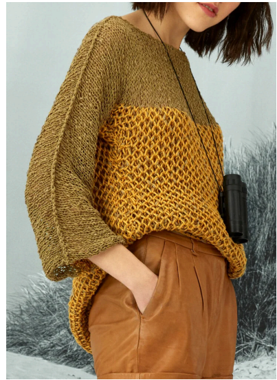
Stricken Pullover mit zweifar- bigem Netzpatent