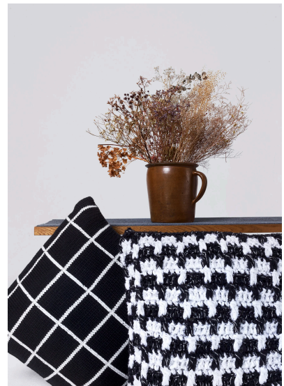
Häkeln Kissen im Schwarz-Weiß-Muster