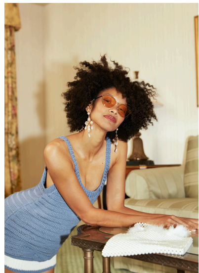
Stricken Tanktop Aurelia