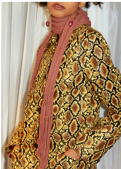
Stricken Fransenschal Alma: schmaler Schal mit langen Fransen