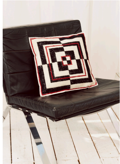
Sticken Op Art Kissen