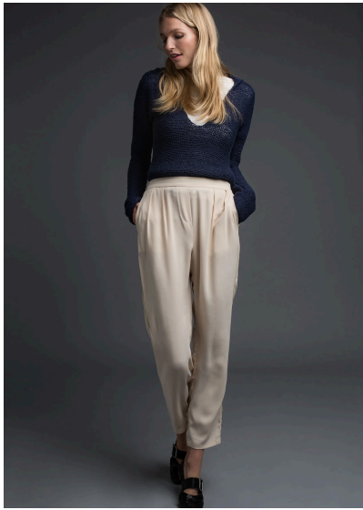
Stricken Pullover mit V- Ausschnitt und Kragen