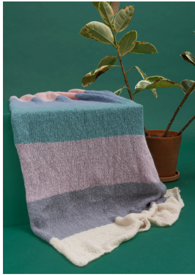
Stricken Gestricktes Streifenplaid