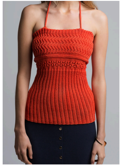
Stricken Strick-Top mit Aranmuster