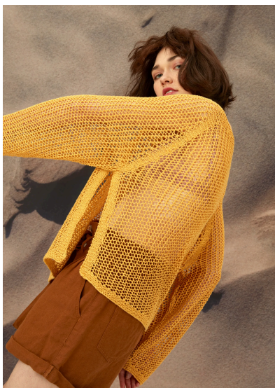
Stricken Raglanpullover mit Netzmuster