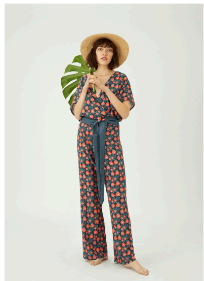
Nähen Blumen Jumpsuit