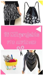
15 Tolle Projekte für Anfänger!