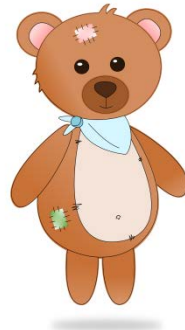
BEN DER BÄR