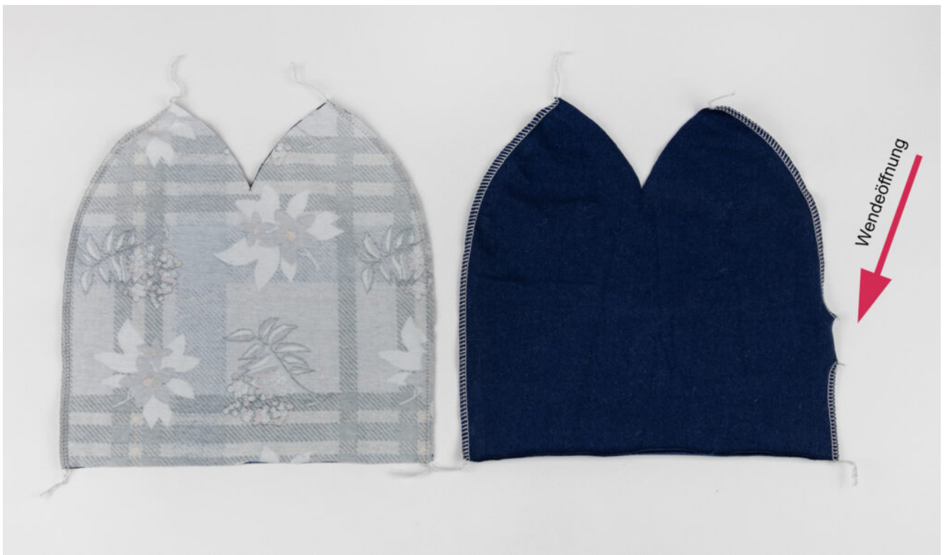
Wendebeanie nähen – Schritt 4

Nähe die Schnittteile mit einem elastischen Stich an den Außenkanten zusammen.