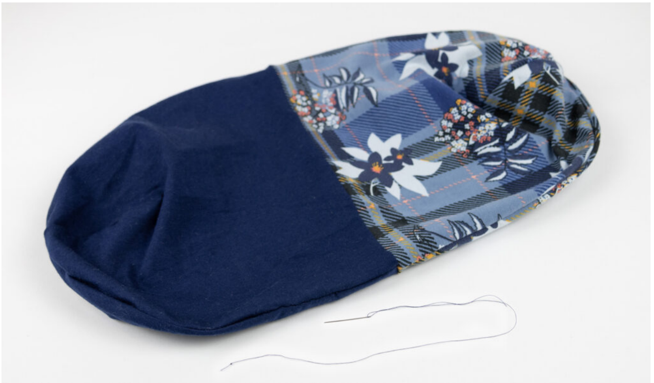
Wendebeanie nähen – Schritt 12

Schließe die Wendeöffnung mit einem Matratzenstich.