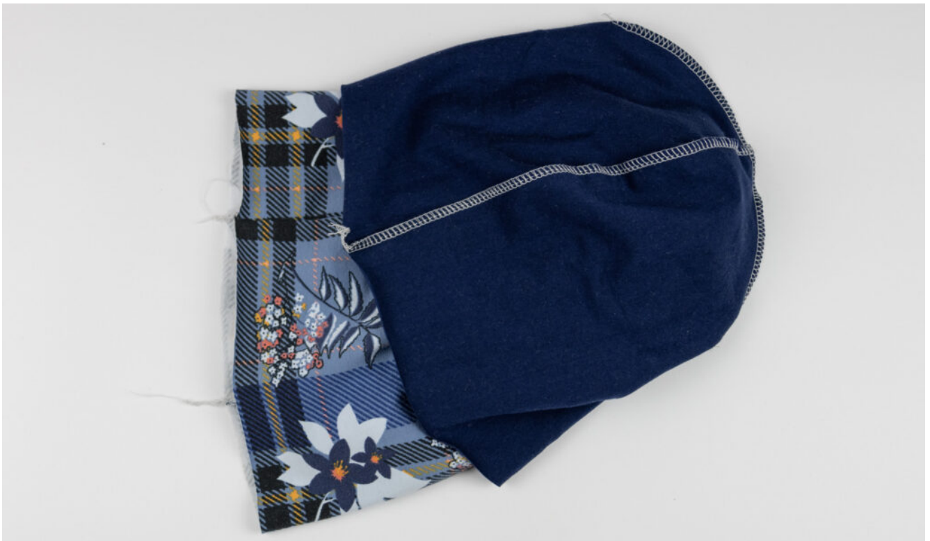
Wendebeanie nähen – Schritt 8