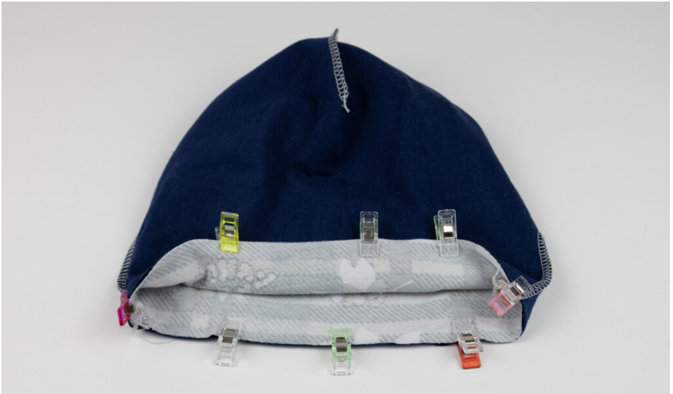
Wendebeanie nähen – Schritt 9

Stecke die Mützen rechts auf rechts ineinander. Achte darauf, dass sich die Seitennähte treffen.