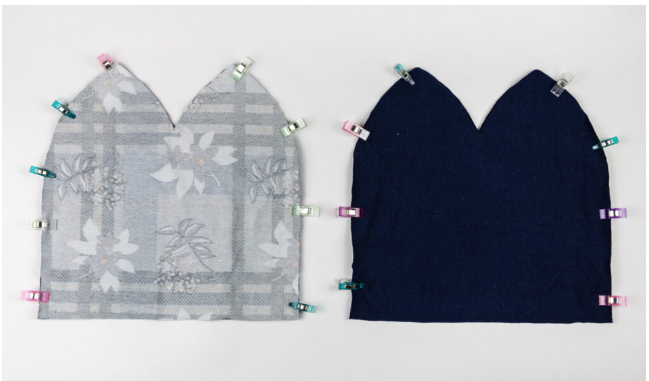
Wendebeanie nähen – Schritt 3

Tipp: Lege den Stoff beim Zuschnitt rechts auf rechts, dann brauchst du ihn anschließend nur noch zusammenstecken.