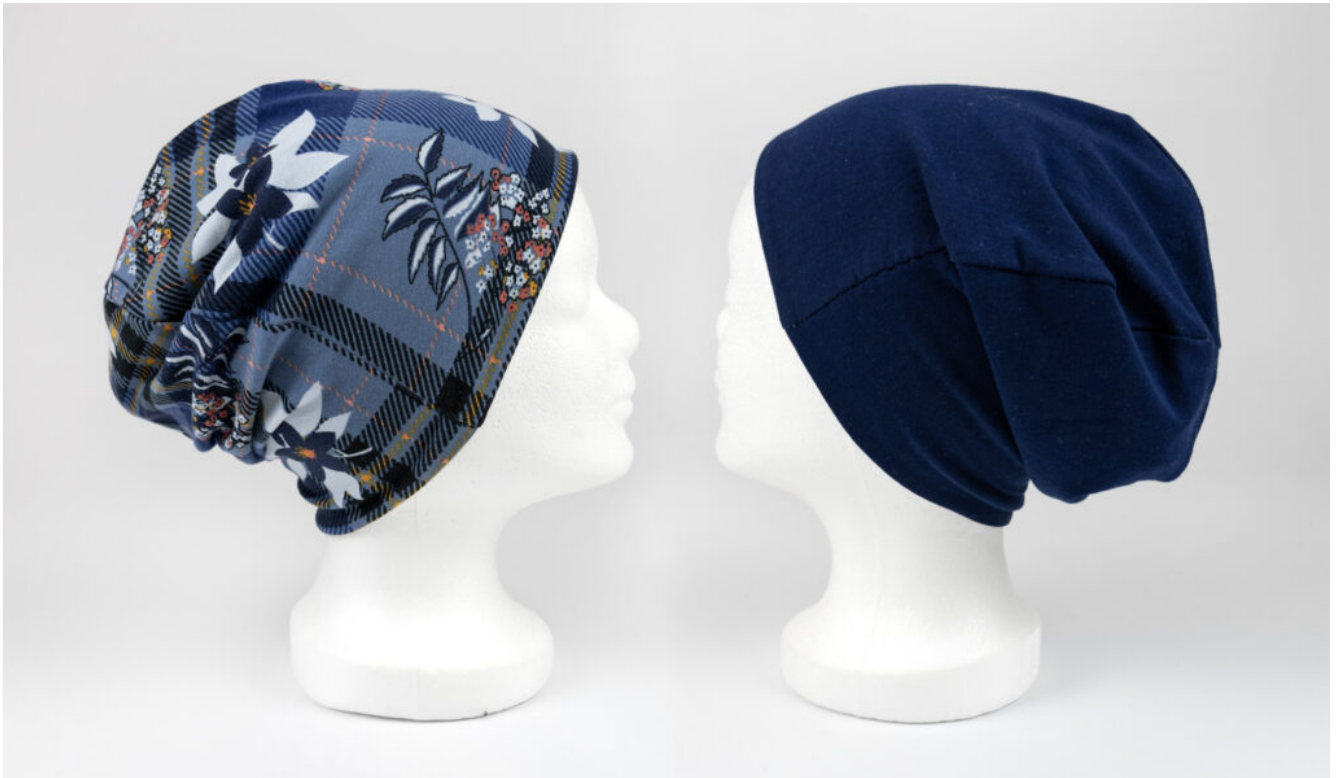
Wendebearie nähen mit kostenlosem Schnittmuster QUIST

Wenn du Stoffreste verwenden möchtest, sollten sie eine Größe von 60cm x 30cm haben. Davon benötigst du je Mütze zwei zueinander passende Stücke .