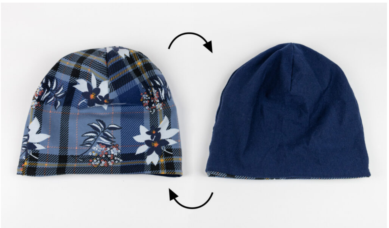
Wendebeanie nähen – Schritt 13

Wie du ihn genau anwendest zeige ich dir in meinem Beitrag Matratzenstich nähen .