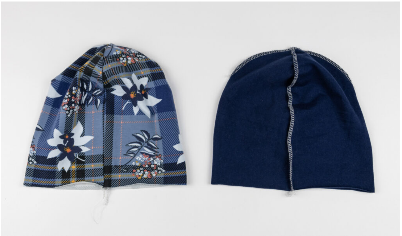
Wendebeanie nähen – Schritt 7