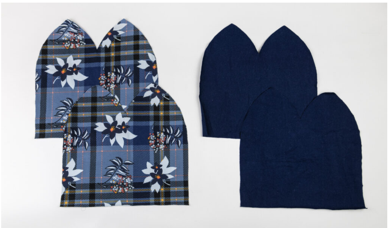
Wendebeanie nähen – Schritt 2

Nahtzugabe von 1 cm ist bereits enthalten.