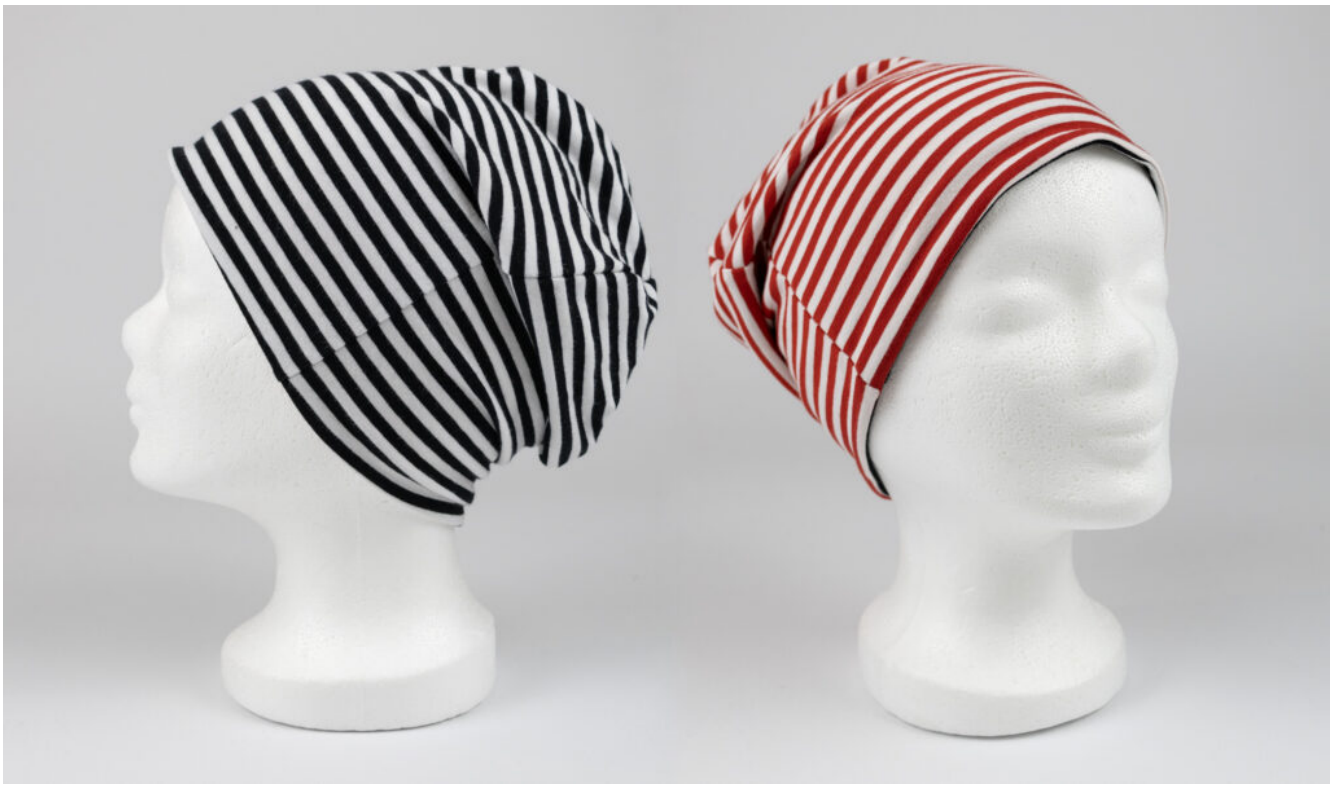
Wendebeanie nähen mit kostenlosem Schnittmuster QUIST