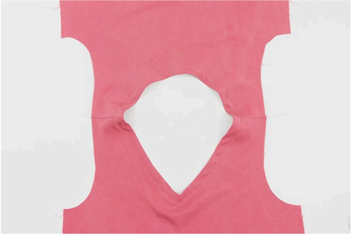
( https://blog.bernina.com/de/wp-content/uploads/sites/2/2021/04/rose-15.jpg )

12. Klappt Euer Nähprojekt auf, sodass es mit der rechten Seite nach oben vor Euch liegt.