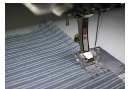
( https://blog.bernina.com/de/wp-content/uploads/sites/2/2014/09/Anleitung-Bernina-1.jpg )