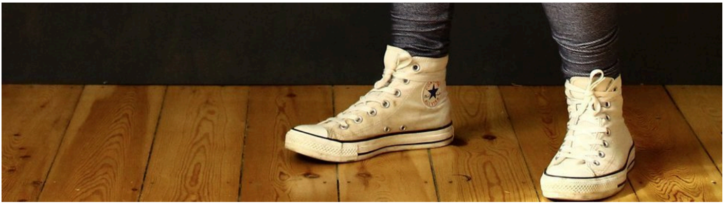
( https://blog.bernina.com/de/wp-content/uploads/sites/2/2014/09/für-Bernina-21.jpg )

Das rechteckige Rockteil an der offenen Stelle zusammenstecken und entweder mit einer Overlock-Maschine oder einer normalen Nähmaschine (Geradstich, anschließend die Nahtzugaben mit Zick-Zack-Stich versäubern) schließen.