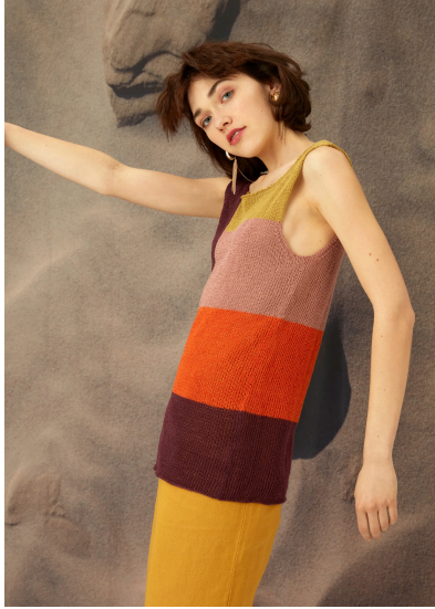
Stricken Tanktop Colourblocking