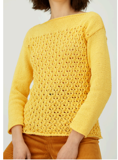
Stricken Gelber Ajourpullover