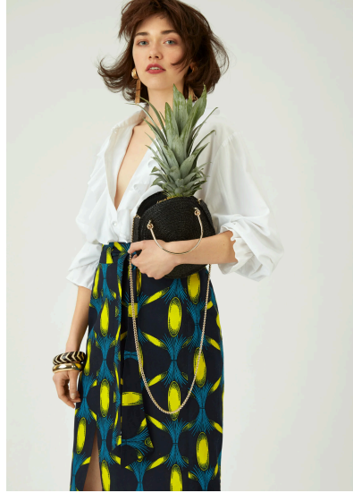
Nähen Midi Rock