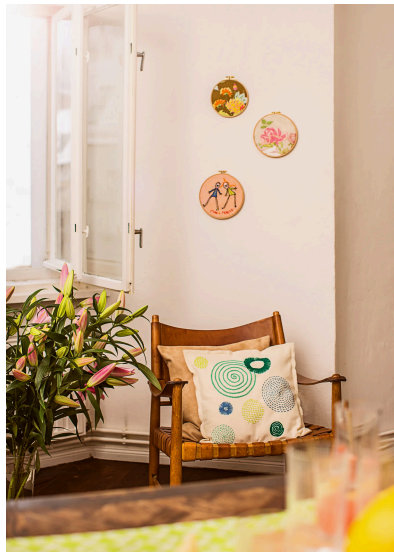
Sticken Stickbilder mit Blumen und Kinderzeichnung