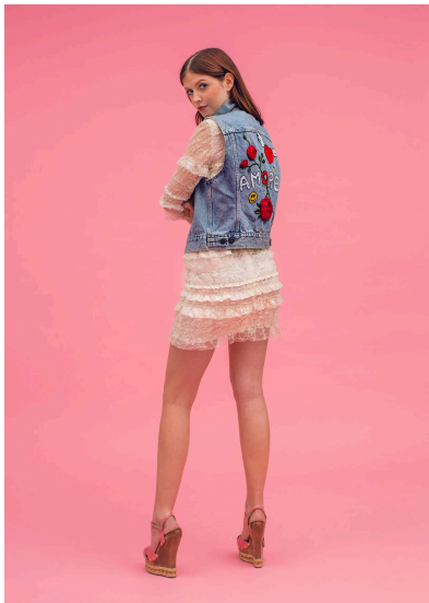
Sticken Jeansweste mit Stickerei