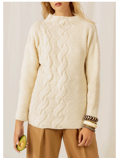
Stricken Pullover mit fal- schem Zopfmuster