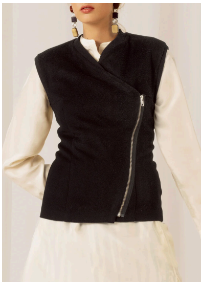
Nähen Bikerweste aus Wolle