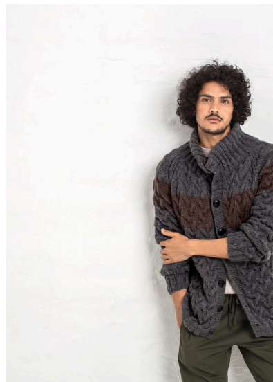
Stricken Herrenjacke mit Zopfmuster