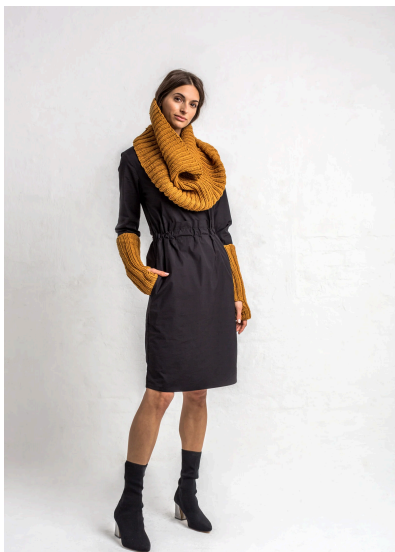
Stricken Loop und Armstulpen mit Rippenmuster