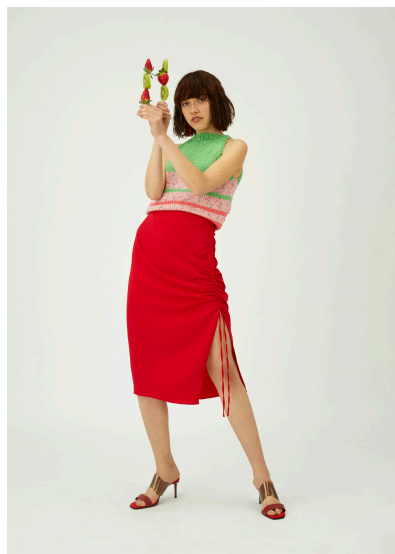
Stricken Top amerikanischer Ausschnitt