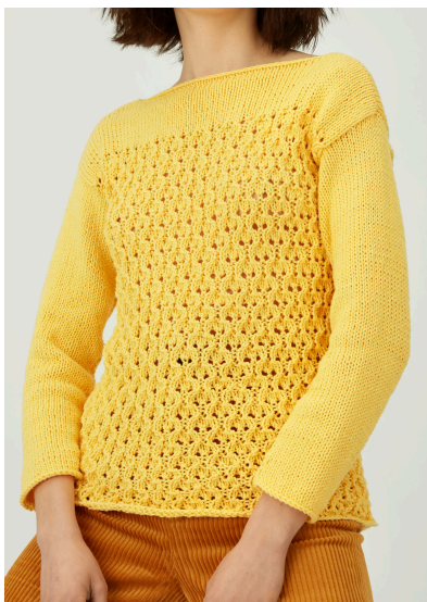
Stricken Gelber Ajourpullover