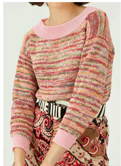
Stricken Bunter Pullover mit dreiviertel Arm