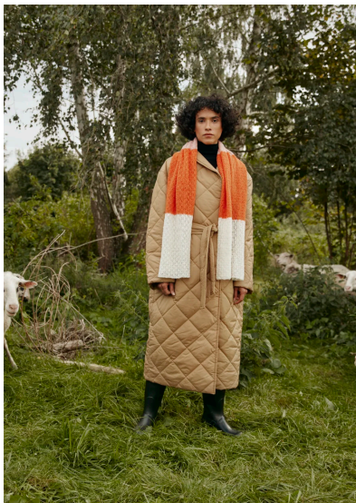
Stricken Schal Daisy