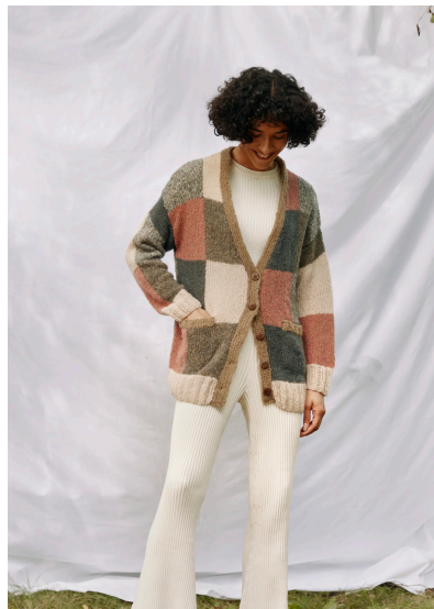
Stricken Cardigan Dalia