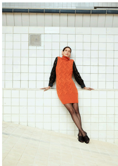
Stricken Ärmelloses Kleid