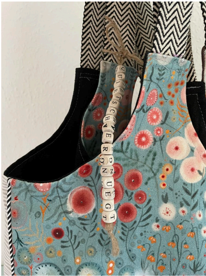
Perfekt zur großen Einkaufstasche: Unser TeelassenTaschchen-Schnitt als kleiner Taschen-Organizer.