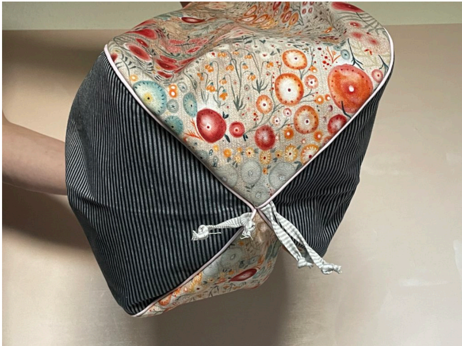
Super auch in dem dezenten Taschentuch-Karq von Stoffe.de