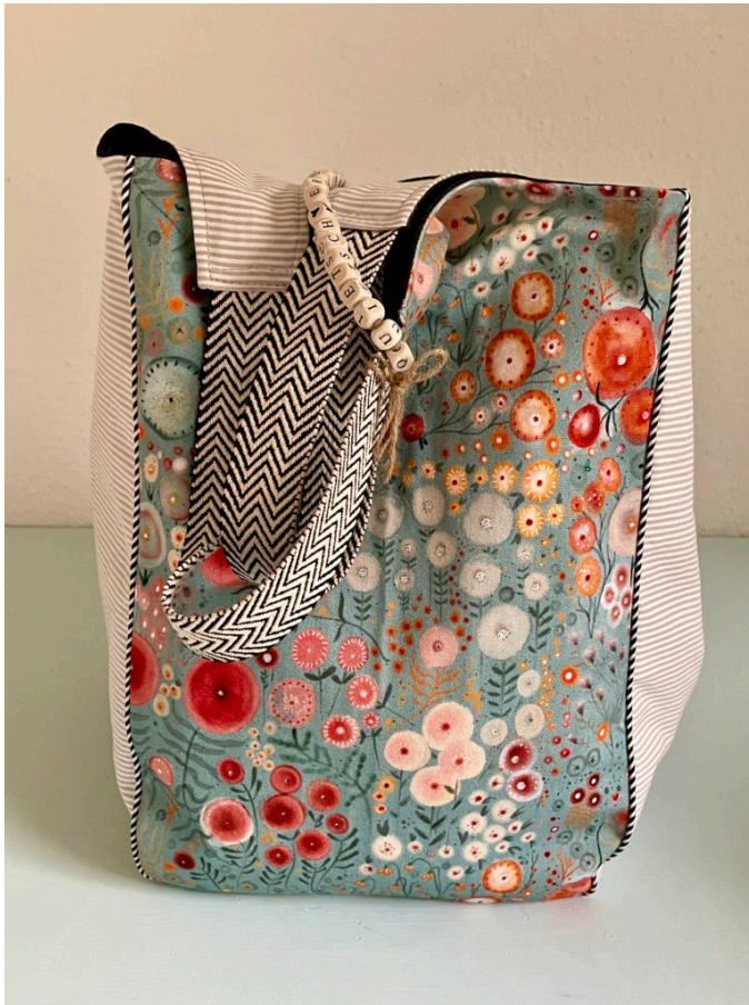
Mix aus Canvas und Baumwolle: Perfekt für die Quitschvergnügt-Tasche