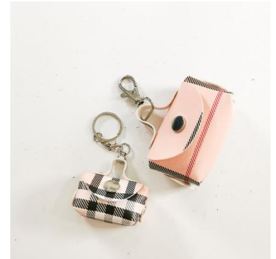
Fertig ist dein zuckersüßes Dekotäschchen ohPupsi wahlweise in Mini oder Big.