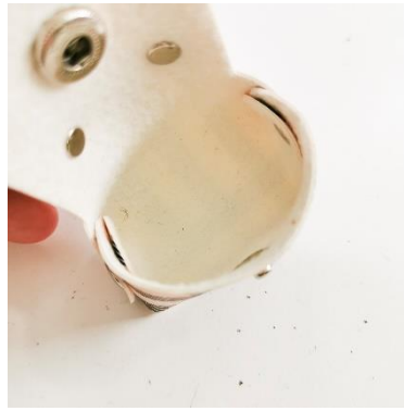
Wiederhole diese Schritte auch auf der anderen Seite.