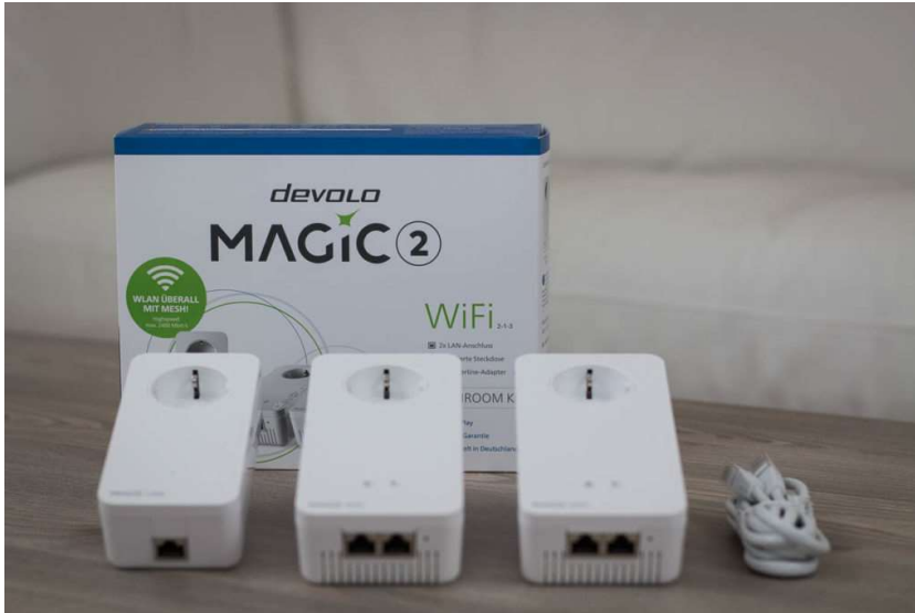
Das devolo Magic 2 Multiroom Kit

Hierfür sorgt dann ein weiterer Powerline Adapter, der das Signal entweder per WLAN oder per LAN zur Verfügung stellt und das, je nach Leitungsqualität fast verlustfrei.